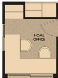
SUGERENCIA HOME OFFICE