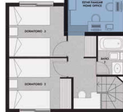
PISO 2 CON PROPUESTA DE AMPLIACIÓN SUGERIDA