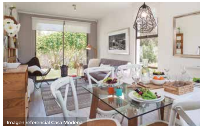
Imagen referencial Casa Módena

En San León, encontrarás el lugar perfecto para iniciar tu vida familiar. Cuenta con casas aisladas y urbanización subterránea en calles interiores. El proyecto se encuentra ubicado en un sector consolidado de Nos. Estarás cerca de colegios, supermercados y del Mall Plaza Sur. Además, tienes accesos directos a la ciudad a través de la Autopista Central y del nuevo servicio del Metrotren Express.