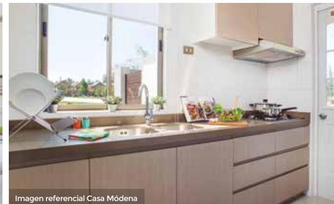
Imagen referencial Casa Módena